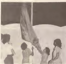
Inauguracion conmovedora di e bandera di Aruba na stadion ariba 18 di Maart 1976.